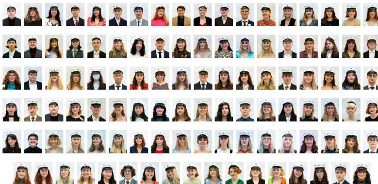
Stúdentar frá Menntaskólanum við Hamrahlíð 19. des 2020

Ítarlegri nemendatölfræði er að finna í sjálfsmatskýrslu skólans.